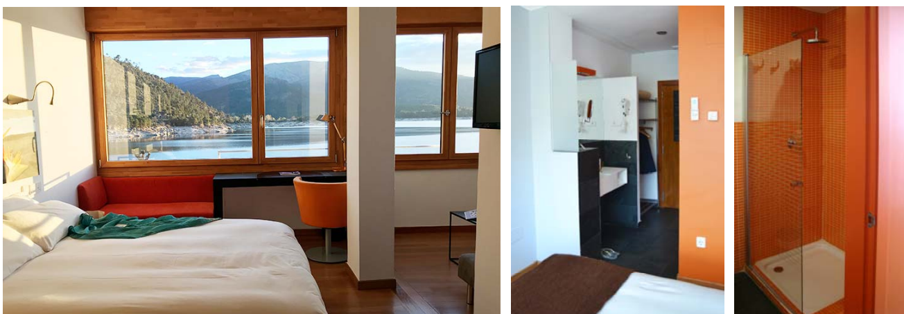
Habitación 2: habitación doble con vistas, cama doble de 1,50m, zona de estar, posibilidad de supletoria y baño con ducha. Planta baja.